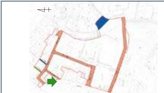
一美濃市 吉川土地区画整理地内一 県道美濃川辺線 (施行期間：H 25～H 29)