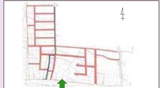
一美濃市 美濃インター前土地区画整理地内一 12 街区、15 街区西部周辺 (施行期間：H 15～H 27)