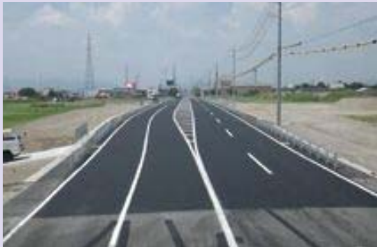
②都市計画道路 馬場北方線整備状況