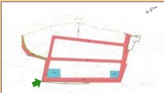
—郡上市 初納土地区画整理地内— 区画道路6-1号線整備状況 (施行期間：H 18～H 26)