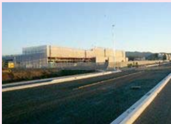
都市計画道路 東本郷錆物師屋線整備状況