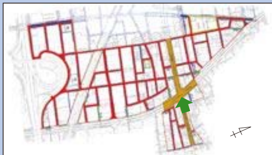
一羽島市 インター北土地区画整理地内一 都市計画道路 本郷三ツ柳線整備完了 (施行期間：H 13～H 28)