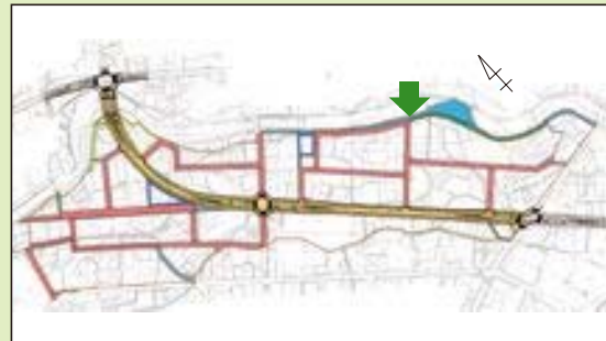
—多治見市 神戸・栄土地区画整理地内— 区画道路 6-9号線整備状況 (施行期間：H 16～H 27)