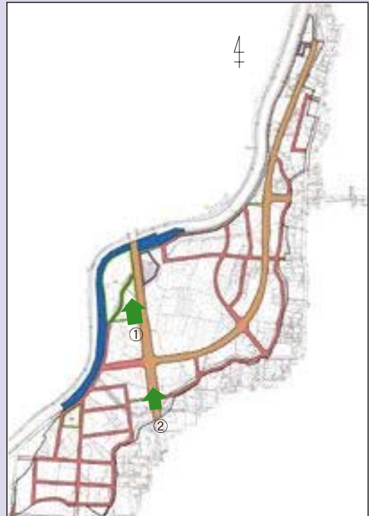
—北方町 高屋西部土地区画整理地内— (施行期間：H 22～H 31)