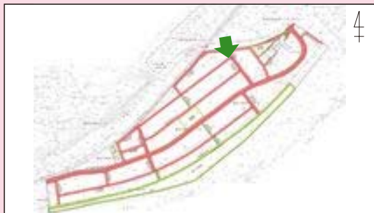
一各務原市 鞆沼駅東部第二土地区画整理地内一 12街区 整備状況 (施行期間：H 22～H 26)