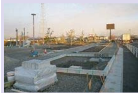
①河川公園整備状況