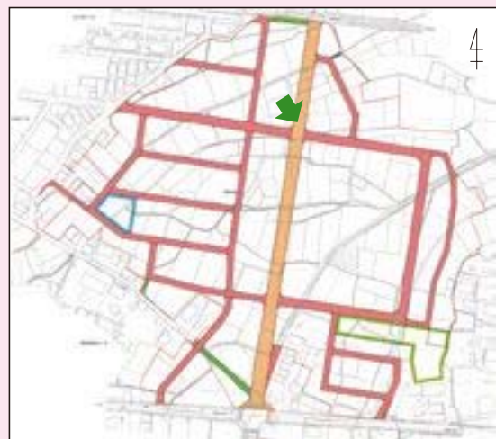
—関市 笠屋土地区画整理地内— (施行期間：H 22～H 28)