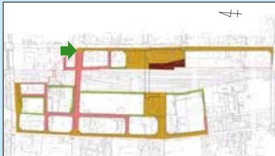
—高山市 高山駅周辺土地区画整理地内— 都市計画道路 路花里本母線整備完了 (施行期間：H 10～H 29)