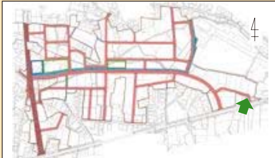
一関市 平賀第一土地区画整理地内一 区画道路 9-1 号線整備状況 (施行期間：H 24～H 30)