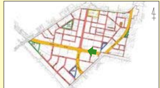
一羽島市 駅北本郷土地区画整理地内一 都市計画道路 大垣一宮線整備完了 (施行期間：H 19～H 29)