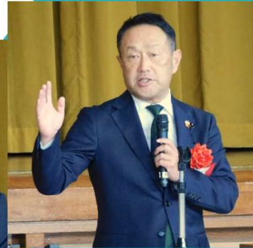
岐阜県議会議員 森 治久様