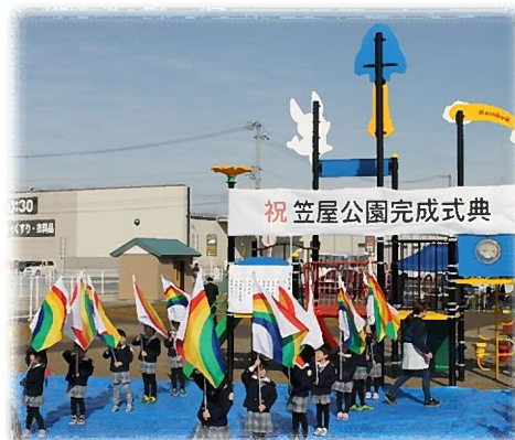
童心保育園の園児のみなさんによる鼓笛