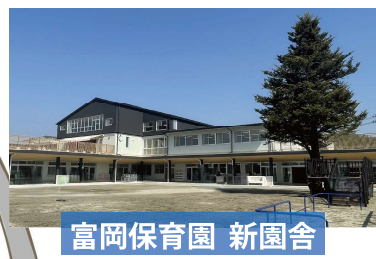
富岡保育園 新園舎