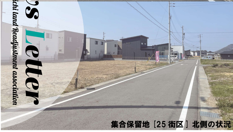
集合保留地 [25 街区] 北側の状況

向夏の候、組合員の皆様におかれましては、当組合の事業推進に格別のご理解、ご協力を賜り、厚く御礼申し上げます。組合設立から11年が経過し、早期に保留地処分が完了できるよう役員一丸となり進めております。組合員の皆様におかれましても、引き続きご理解、ご協力をお願いします。