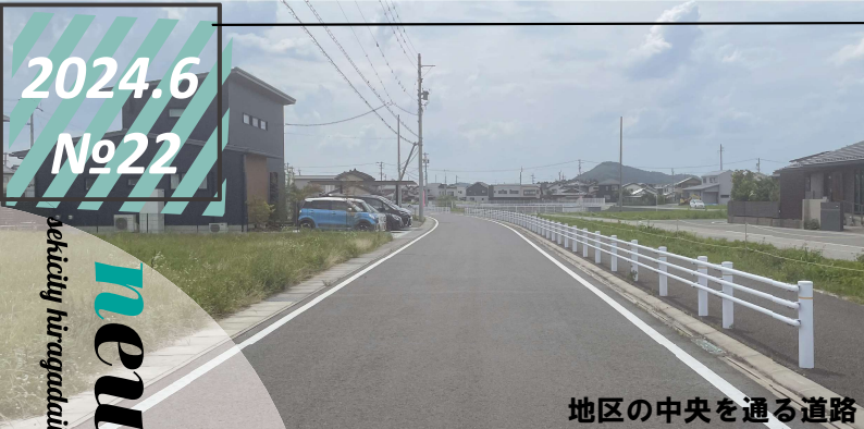
地区の中央を通る道路