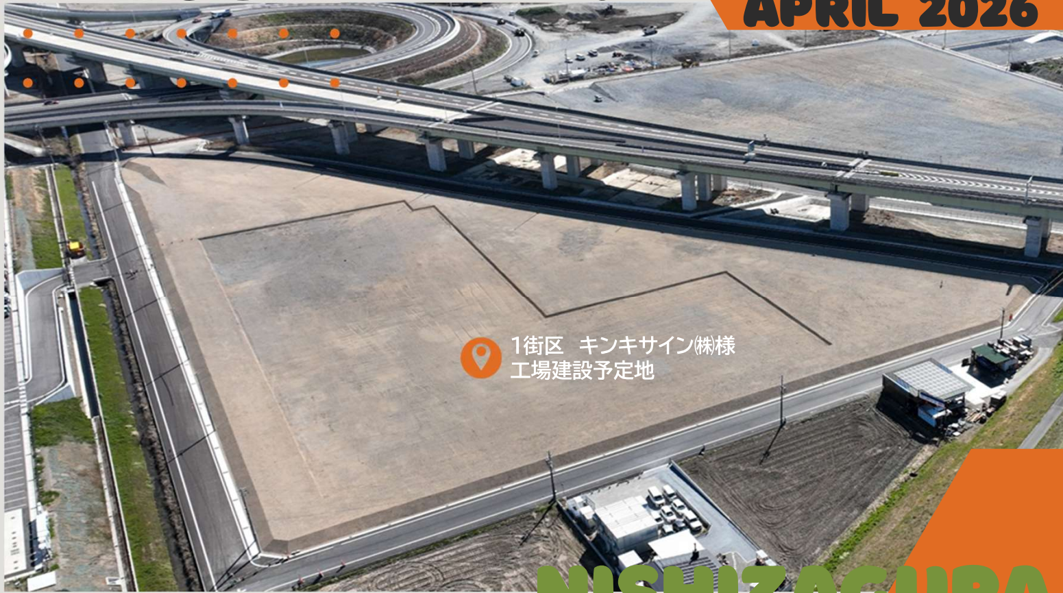
1街区 キンキサイン(株)様 工場建設予定地