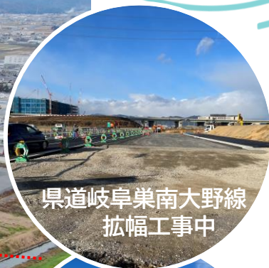
県道岐阜県南大野線 拡幅工事中