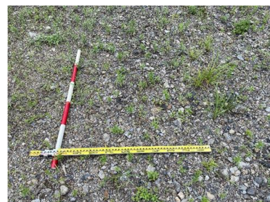
搬出前の土砂確認