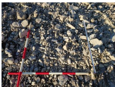
搬入後の土砂確認

国、県、町、NEXCO等の公共工事の受入れにあたり、土の品質を確認するため、搬出元機関との協議を行い、環境基準の証明書を提出頂き、土砂の確認を行いながら良質な土砂のみ受入れを行っております。