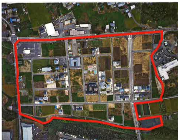
美濃市美濃西部土地区画整理事業