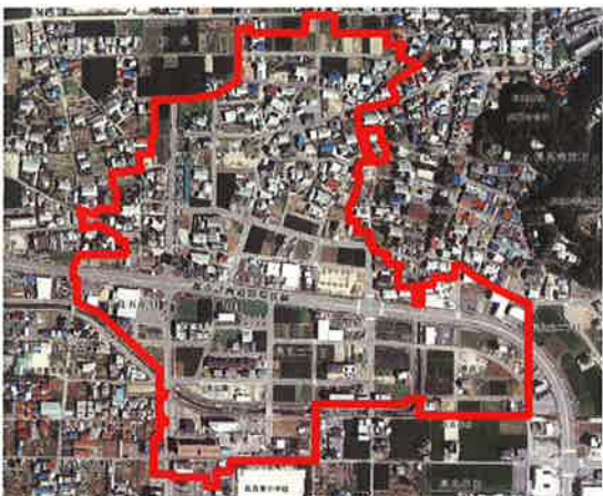
岐阜市真福寺南土地区画整理事業