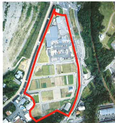
美濃市曾代土地区画整理事業