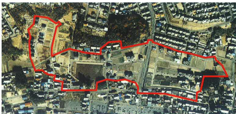
各務原市上田土地区画整理事業