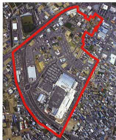
岐阜市正木土地区画整理事業