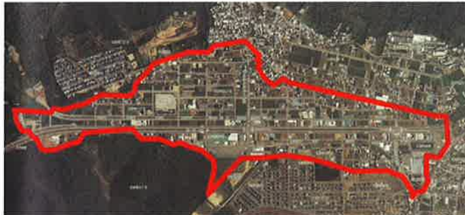
岐阜市日野土地区画整理事業