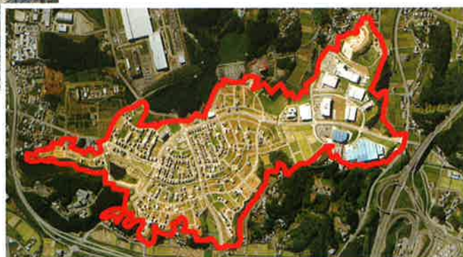
美濃加茂市中部台地土地区画整理事業