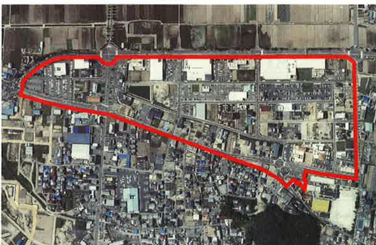
岐阜市正木北部土地区画整理事業