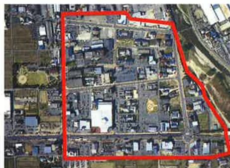
恵那市正家第一土地区画整理事業