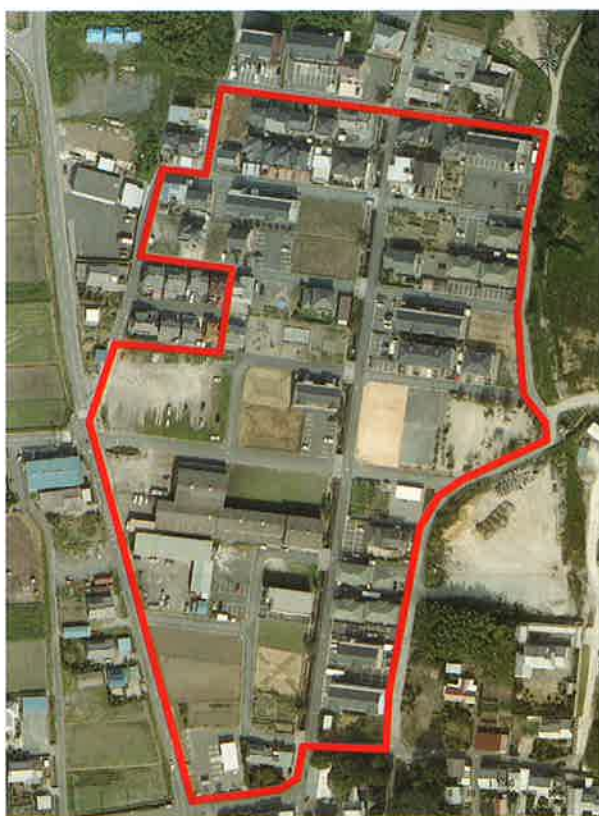
大垣市昼飯北部土地区画整理事業