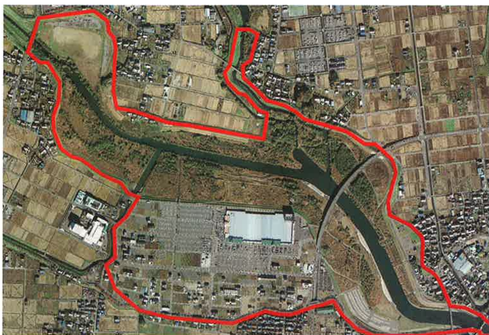
犀川堤外地土地区画整理事業