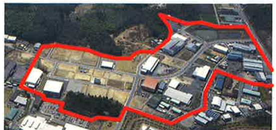
関市尾太土地区画整理事業