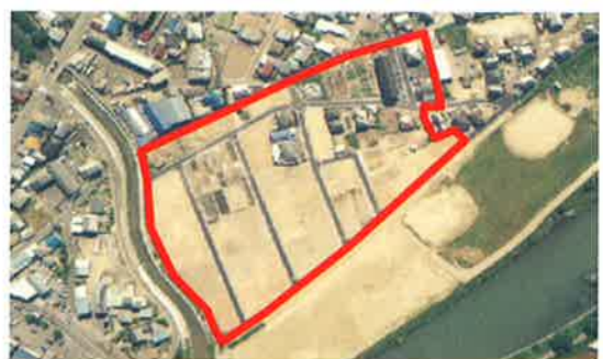
関市神明土地区画整理事業