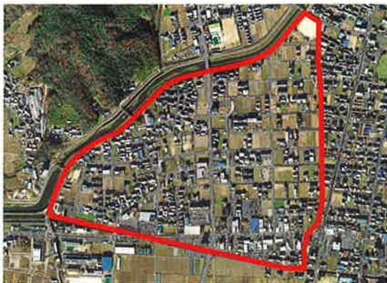
岐阜市上土居土地区画整理事業