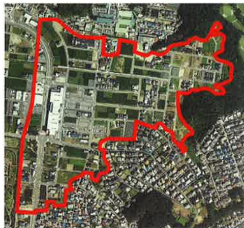
岐阜市堀田土地区画整理事業