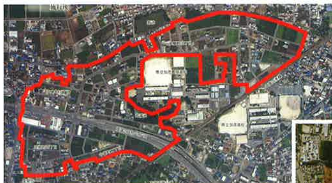
美濃加茂市宮浦土地区画整理事業