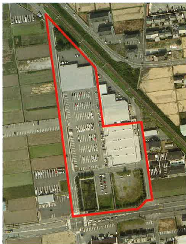
大垣市昼飯南部第一土地区画整理事業