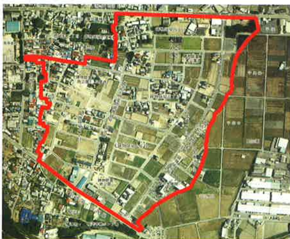
関市鋳物師屋土地区画整理事業