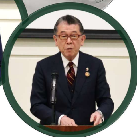
▶ 早野町長あいさつ