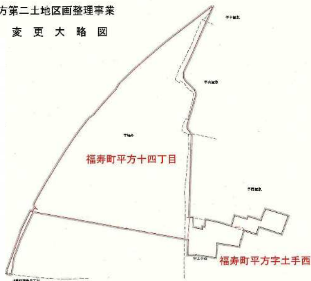
平方第二土地区画整理事業 変更大略図