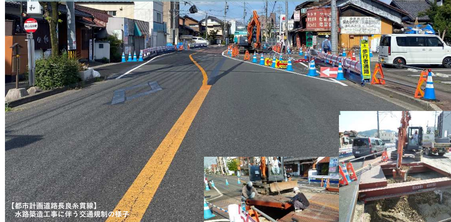
【都市計画道路長良糸貫線】 水路築造工事に伴う交通規制の様子