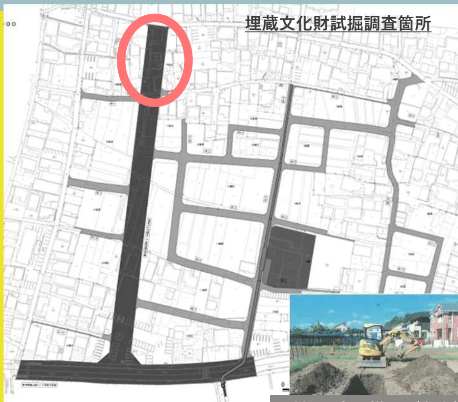
埋蔵文化財試掘調査箇所

今年度中に都市計画道路鷺山下土居線の北エリアの埋蔵文化財試掘調査を実施予定です。