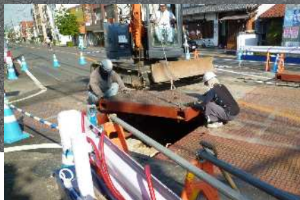
【都市計画道路長良糸貫線】 水路築造工事の様子