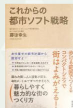
【著書】これからの都市ソフト戦略

スターバックスコーヒーを日本に紹介し日本での事業展開のきっかけを作った「伊勢商人」三重県出身。大学卒業後、松坂屋(現・株式会社大丸松坂屋百貨店)を経て渡米。米流通業のノウハウや街づくりを日本に紹介する米国法人を設立。日米往復の中、森ビル株式会社・故森稔と出会い、アークヒルズ、六本木ヒルズ、ヴィーナズフォートなどの商業における都市開発を成功に導く。その傍ら、地方都市の中心地再開発に携わり、民官一体の地方創生を説く。当県においては、岐阜駅商業施設「アクティブG」や「岐阜シティタワー43」等の、岐阜駅周辺再整備について指導、助言をいただく。森ビル株式会社、日本マクドナルド株式会社、株式会社読売新聞東京本社、株式会社ポケモン、タリーズコーヒー・ヒージャパン株式会社等顧問、みえの国観光エグゼクティブ・アドバイザー。