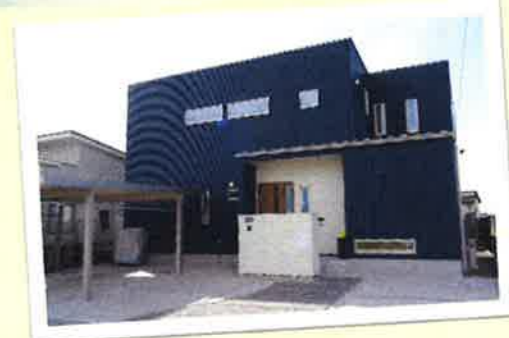
沢山の方が、新しい生活を始めています。

令和3年度7月現在67筆販売しました。新しいお店や住宅建築も進み、まち並みも変化しています。お知り合いの方で土地購入を検討されている方がいらっしゃいましたら、事務局(058-322-5500)までご連絡ください。