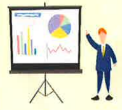
令和2年度事業費収入支出決算(単位:千円)

1議案について審議が行われ、賛成多数で議決されました。 今年度、借入が無くなり、収支がプラスになりました。