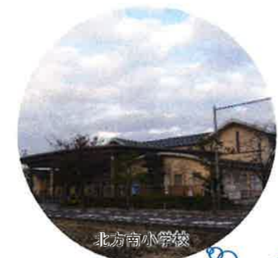
小中一貫校へ 2023年開校予定